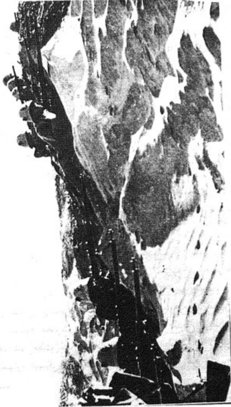
مناورة الجنود الاتراك في قرقارش

اختراقها، ولم يقم الإيطاليون بإخلاء منطقة لاطلاق النار أمام بنادقهم، الأمر الذي سهل على العرب - عندما ظهرُوا في هذه المنطقة قبيل الثالث والعشرين من أكتوبر - الاقتراب من (البرساليري) لدرجة التلامس بالأيدي إذا أرادوا باستثناء منطقة الهاني حيث لم يكن هناك خنادق، أو مدافع أو أية تحصينات دفاعية.